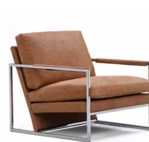
LT M = Matalaselkäinen tuoli LT M = Chair with a lower back