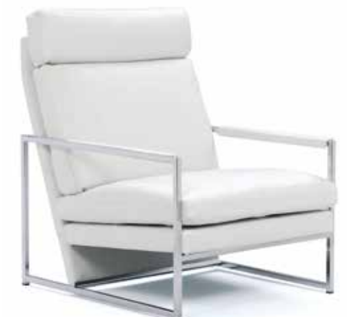
LT K = Korkeaselkäinen tuoli LT K = Chair with a higher back